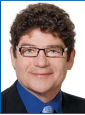
POUR COMMENTER LE BILLET DE BLOGUE DE PIERRE PAQUETTE