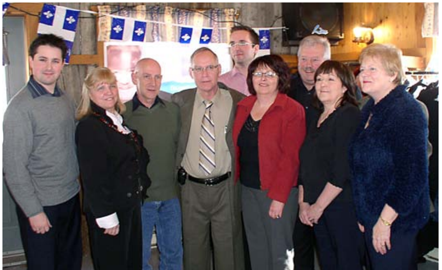
Conseil exécutif du Bloc Québécois de Montcalm