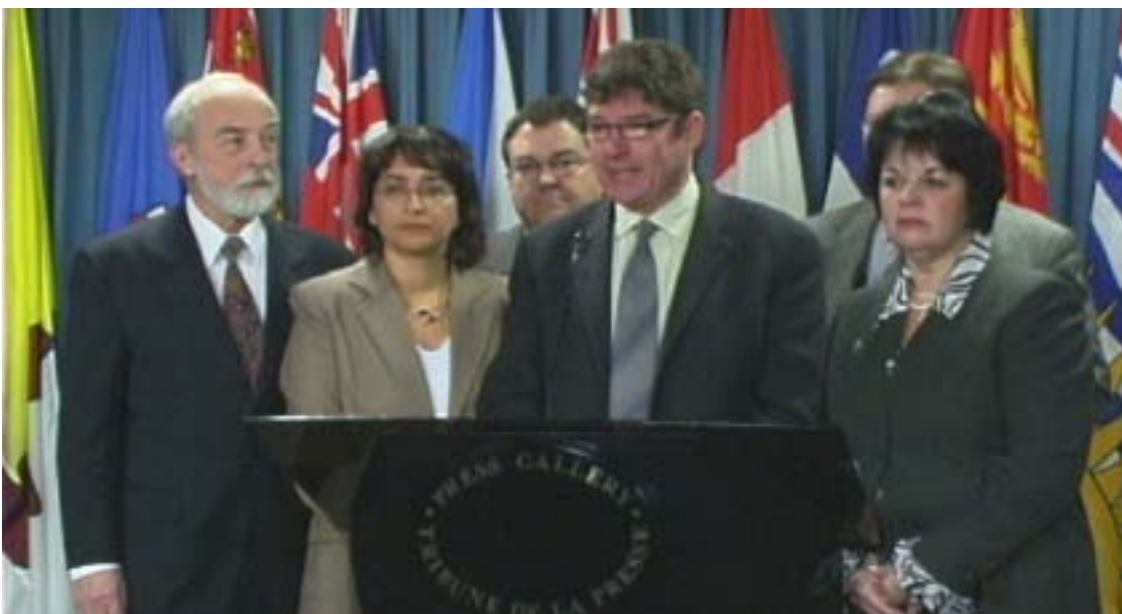
Les députés du Bloc Québécois au moment de la conférence de presse conjointe réalisée cette semaine. De gauche à droite : Yves Lessard, Claude DeBellefeuille, Paul Crête, Pierre Paquette, Serge Cardin et Paule Brunelle.