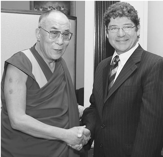
Pierre Paquette rencontre le Dalaï Lama lors de sa visite à Ottawa.